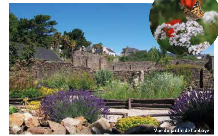
Vue du jardin de l'abbaye

oubliées sont à nouveau à l'honneur dans la cuisine, comme dans les tisanes de grand-mère.