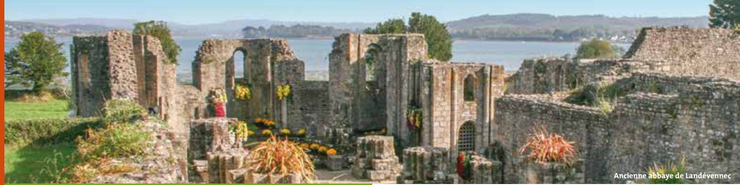
Ancienne abbaye de Landévennec

ancienne abbaye Landévennec 29560 Landévennec • 02 98 27 35 90 musee.landevennec@wanadoo.fr www.musee-abbaye-landevennec.fr